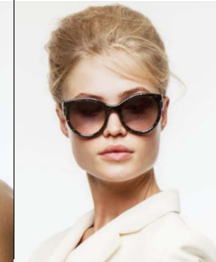
■ 'Thoughtful' zonnebril 329 euro