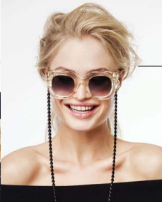
■ 'Devoted' zonnebril 429 euro